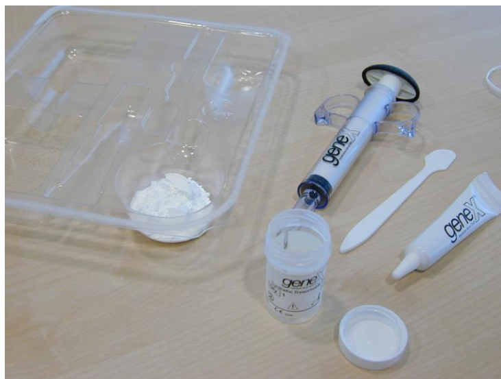
Figura Detalhada de Todos os Componentes do Kit.