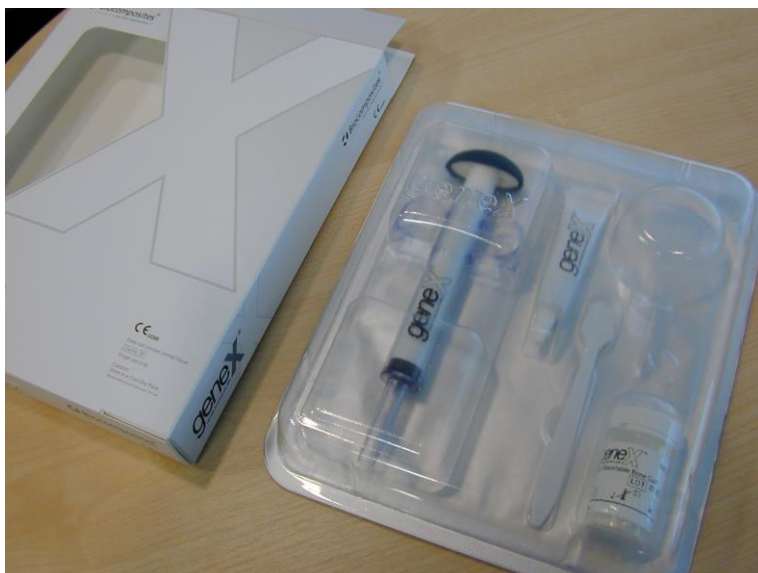
Figura Detalhada da Embalagem na forma que será entregue ao consumo.